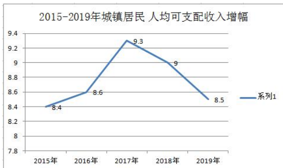
图 2：2015-2019 年城镇居民人均可支配收入增幅

根据住户抽样调查，2019年城镇居民人均可支配收入62397.4元，同比增长8.5%。按收入构成分：工资性收入46771元，同比增长8.7%；经营净收入3900元，同比增长7.0%；财产净收入9145元，同比增长7.4%；转移净收入2581.4元，同比增长10.1%。城镇居民人均消费支出为35629元，同比增长7.2%。